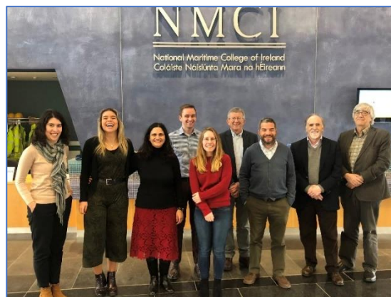
Parceria Onboard durante a 3ª Reunião da parceria, em Cork, Irlanda.

O estudo inicial, realizado pelo consórcio, permitiu aos parceiros responder a estas e outras perguntas, essenciais para definir o roteiro e as etapas a seguir para o desenvolvimento dos perfis e currículos técnicos e do modelo de aprendizagem.